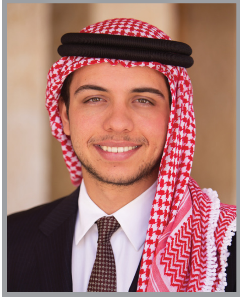
صاحب السمو الملكي الأمير الحسين بن عبدالله الثاني ولي العهد