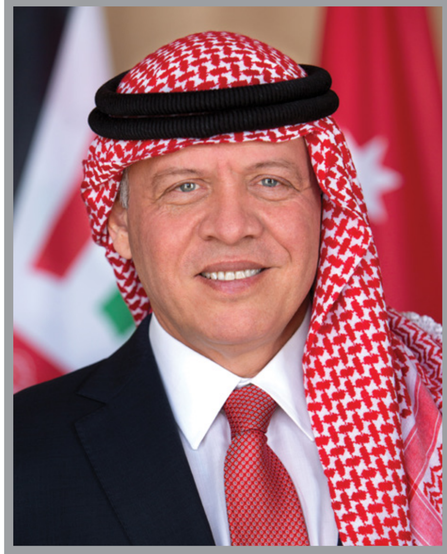
صاحب الجلالة الهاشمية الملك عبدالله الثاني ابن الحسين المُعظم ملك المملكة الأردنية الهاشمية